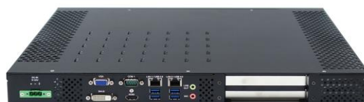
Вид сзади (DC-версия)