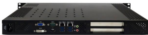
Вид сзади (AC-версия)