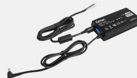
с зачищенными проводами