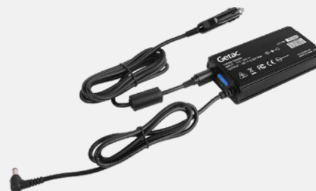
исполнение с разъемом для прикуривателя