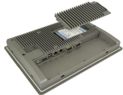
Доступ к SSD / HDD